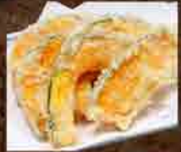
かぼちゃの天ぷら