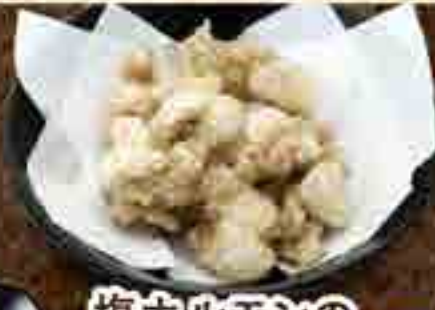
塩ホルモンの 唐揚げ