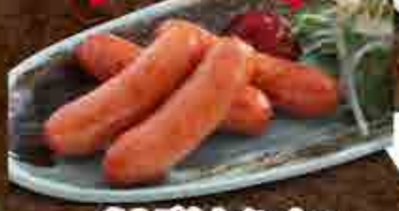
あらびきウインナー