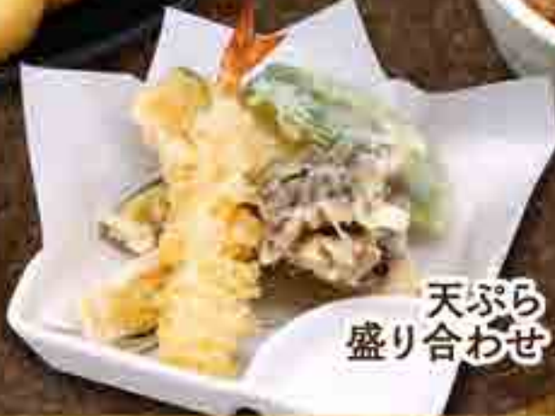
天ぷら 盛り合わせ