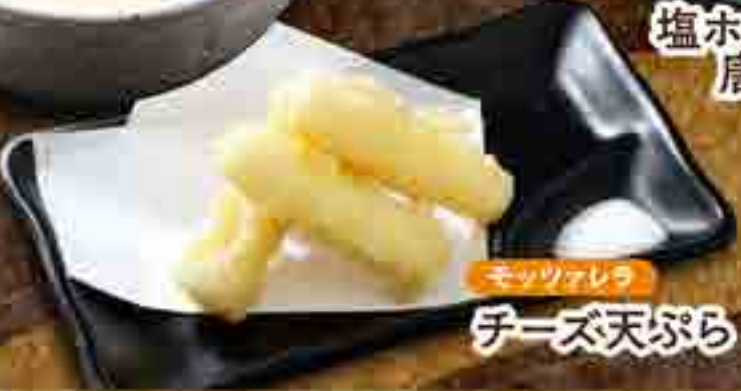
モッツアレラ チーズ天ぷら