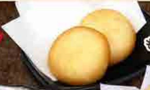
ポテト もちチーズ