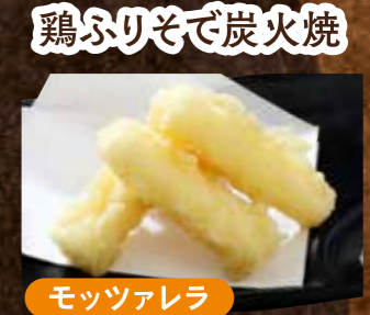
モッツアレラ チーズ天ぷら