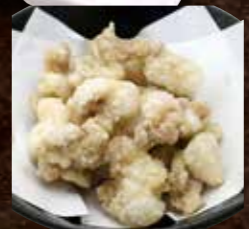
塩ホルモンの唐揚げ