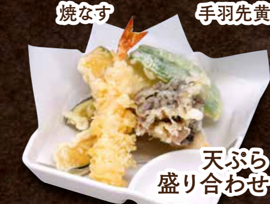
天ぷら盛り合わせ