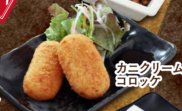
カニクリームコロッケ