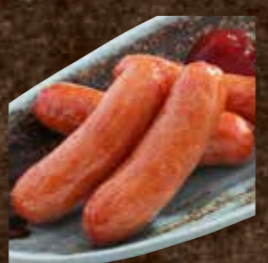
あらびきウインナー