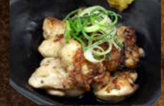
鶏ふりそで炭火焼