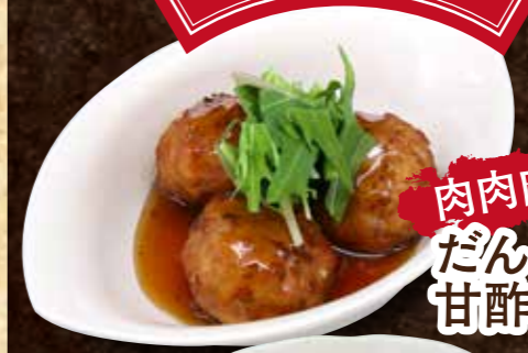
肉肉肉だんごの甘酢かけ