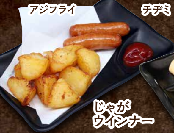
じゃがウインナー