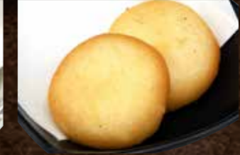
ポテトもちチーズ