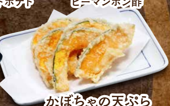
かぼちやの天ぷら