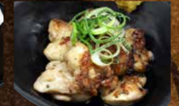
鶏ふりそで炭火焼