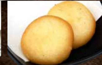
ポテトもちチーズ