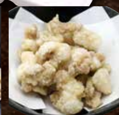
塩ホルモンの唐揚げ