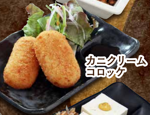
カニクリーム コロッケ