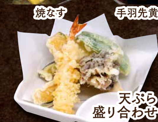
天ぷら 盛り合わせ