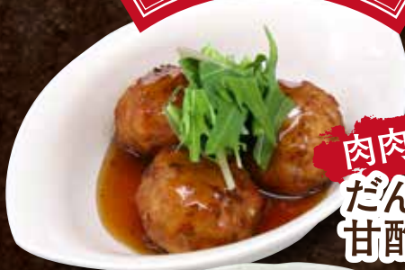
肉肉肉 だんごの 甘酢かけ