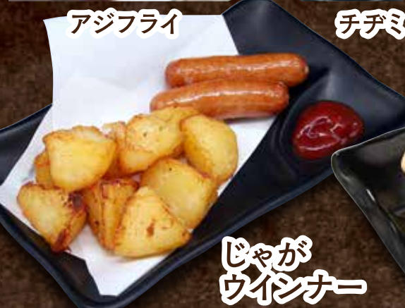
じゃが ウインナー