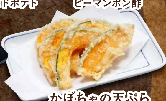
かぼちゃの天ぷら