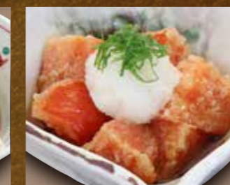
トマトの揚げ出し