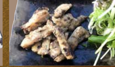
ヤゲン軟骨の炭火焼き