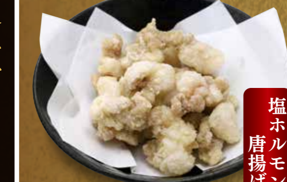
塩ホルモン唐揚げ