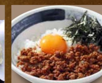
甘辛そぼろの卵かけご飯