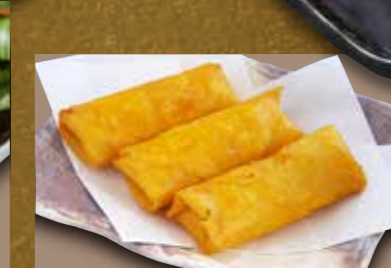
濃厚チーズロール