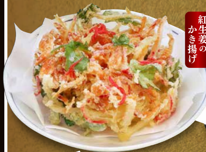
紅生姜のかき揚げ