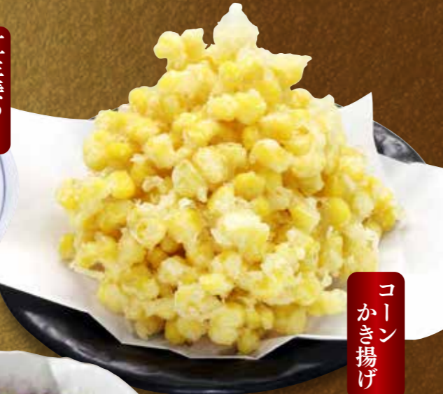
コーンのかき揚げ