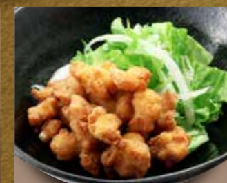
鶏なんこつの唐揚げ