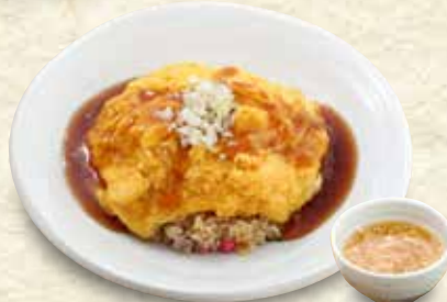
天津炒飯 891円 (税込 980円)