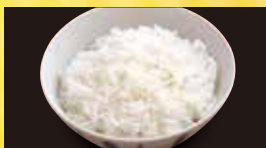
白ご飯 大盛 182円 (税込 200円) 大盛 237円 (税込 260円)