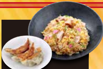
半炒飯+餃子セット 510円 (税込 560円)