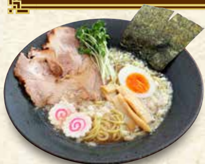
東京下町 ラーメン 891円 (税込 980円)