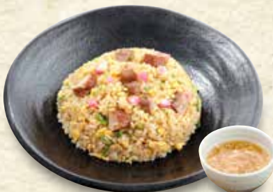
炒飯 728円 (税込 800円)