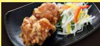
唐揚げ 2個 273円 (税込 300円)