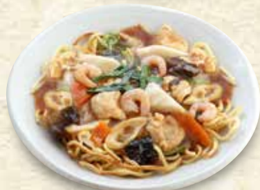
あんかけ焼きそば 891円 (税込 980円)