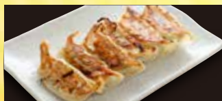
餃子 3個 163円 (税込 180円) 6個 319円 (税込 350円)