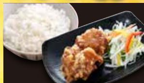
唐揚げセット 455円 (税込 500円)