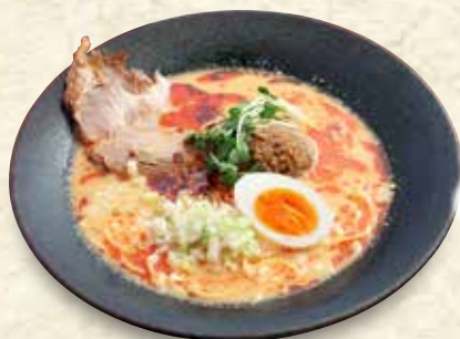
担々麺 891円 (税込 980円)