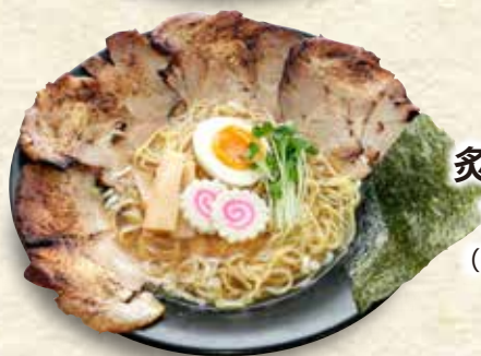
チャーシュー 炙り叉焼麺 1,073円 (税込 1,180円)