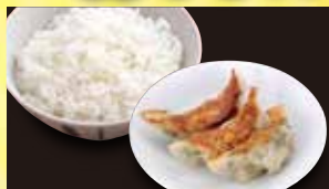
餃子セット 346円 (税込 380円)