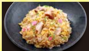
半炒飯 346円 (税込 380円)