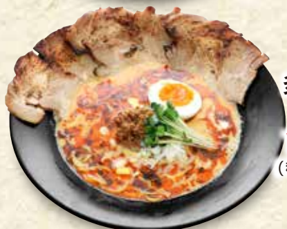
チャーシュー 炙り叉焼 担々麺 1,073円 (税込 1,180円)