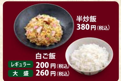
半炒飯 380円(税込) 白ご飯 レギュラー 200円(税込) 大盛 260円(税込)