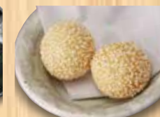
ごま団子 1個 170円(税込)