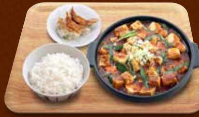
四川麻婆豆腐+餃子コンビ 1,290円(税込)