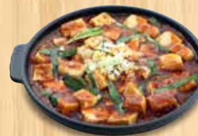
四川麻婆豆腐 1,030円(税込)