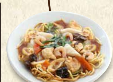
あんかけ焼きそば 980円(税込)