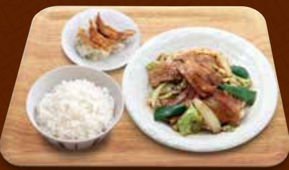
ホイコーロー 回鍋肉+餃子コンビ 1,290円(税込)