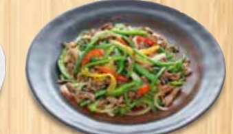
牛肉ピーマン炒め 1,310円(税込)