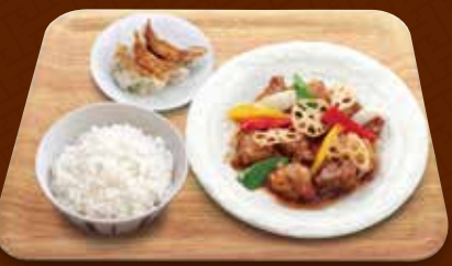
酢豚+餃子コンビ 1,290円(税込)