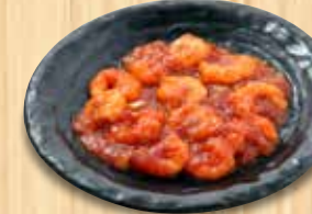
海老のチリソース 1,310円(税込)