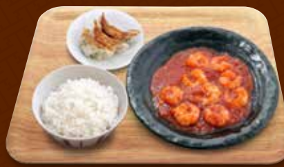
海老のチリソース+餃子コンビ 1,580円(税込)