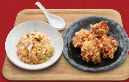
鶏の唐揚げ+炒飯コンビ 1,050円(税込)