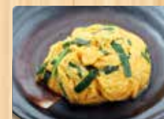
ニラ玉ドーム 800円(税込)