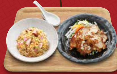
ユーリンチー 油淋鶏+炒飯コンビ 1,180円(税込)