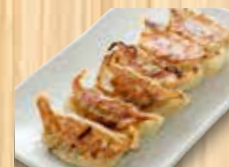
餃子 6個 350円(税込) 10個 580円(税込)