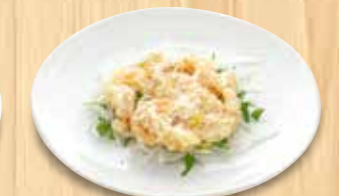
海老のマヨネーズ和え 1,030円(税込)