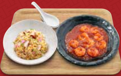
海老のチリソース+炒飯コンビ 1,580円(税込)