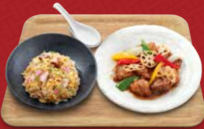
酢豚+炒飯コンビ 1,290円(税込)