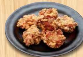
鶏の唐揚げ 6個 850円(税込) 10個 1,200円(税込)