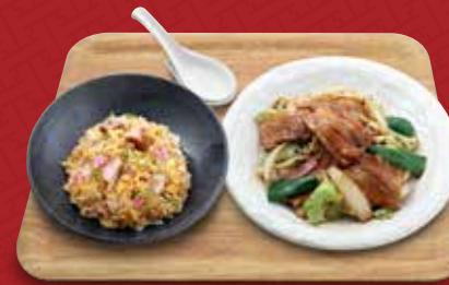
ホイコーロー 回鍋肉+炒飯コンビ 1,290円(税込)