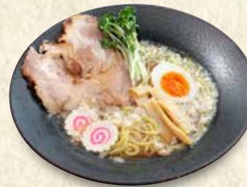
東京下町ラーメン 980円(税込)