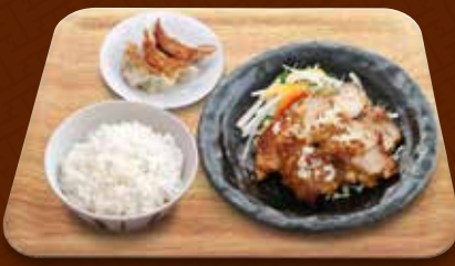
ユーリンチー 油淋鶏+餃子コンビ 1,180円(税込)