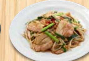
肉ニラ炒め 910円(税込)