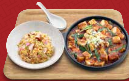
四川麻婆豆腐+炒飯コンビ 1,290円(税込)