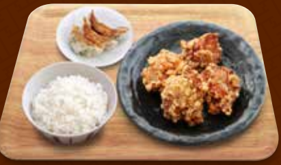
鶏の唐揚げ+餃子コンビ 1,050円(税込)