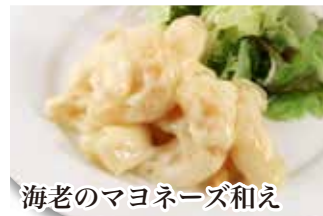
海老のマヨネーズ和え