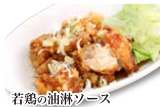
若鶏の油淋ソース