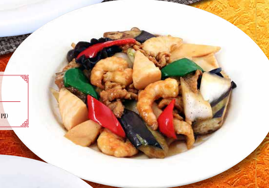
八宝菜 850円 (税込 935円)