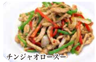
チンジャオロース