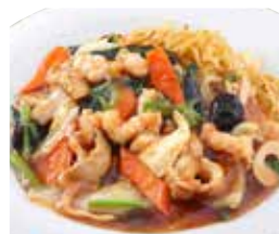
あんかけ焼きそば