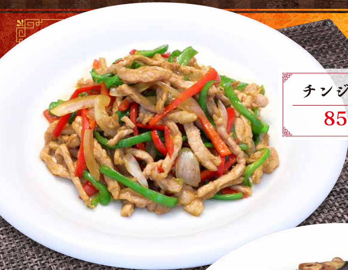
チンジャオロースー 850円 (税込 935円)