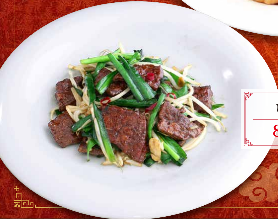
レバニラ炒め 850円 (税込 935円)