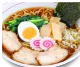
東京下町ラーメン