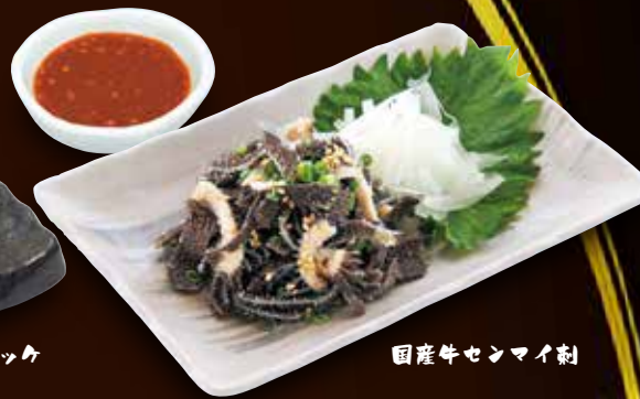
国産牛センマイ刺