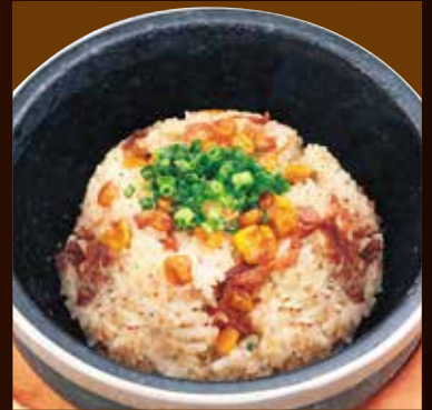
石焼ペッパーガーリックライス