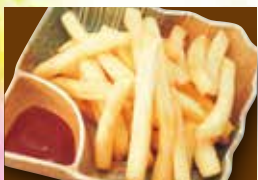
ポテトフライ 290円 (税319円)