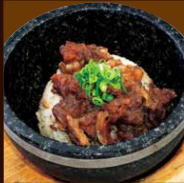
石焼牛すじガーリックライス