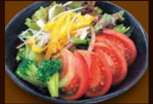
トマトイタリアンサラダ