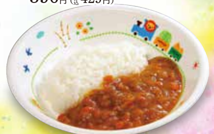
お子様カレー 390円 (税429円)