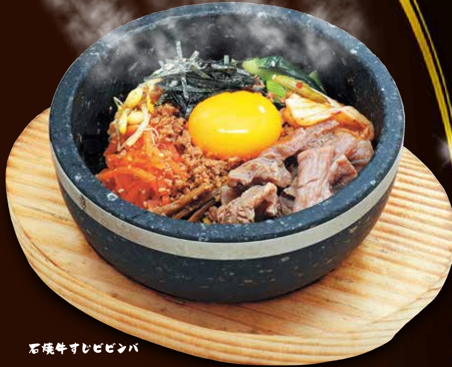
石焼牛すじビビンバ