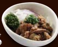
数量限定 牛すじ ポン酢