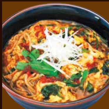
ユッケジャンクッパ