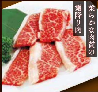
霜降り肉 柔らかな肉質の