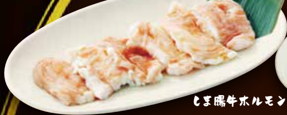
しま腸牛ホルモン