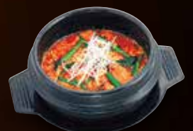
ユッケジャンスープ