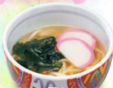
お子様うどん 390円 (税429円)