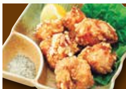
とり唐揚げ 590円 (税649円)