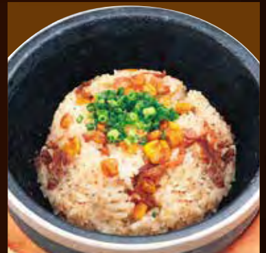
石焼ペッパーガーリックライス