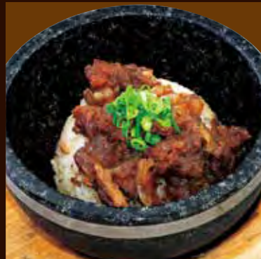
石焼牛すじガーリックライス