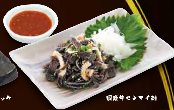
国産牛センマイ刺