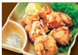
とり唐揚げ 590円 (税649円)