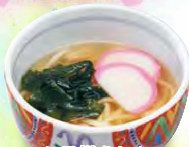
お子様うどん 390円 (税429円)