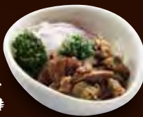
数量限定 牛すじ ポン酢