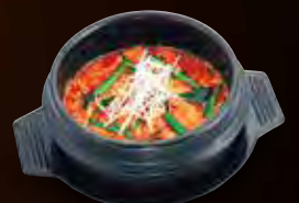
ユッケジャンスープ