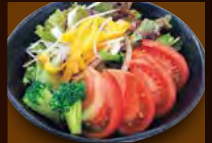
トマトイタリアンサラダ