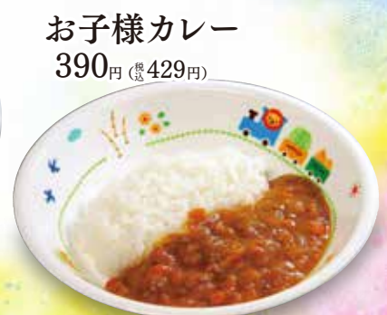
お子様カレー 390円 (税429円)