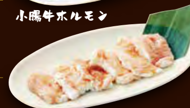
しま腸牛ホルモン