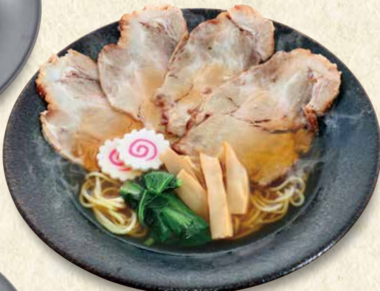
チャーシューメン 叉焼麺 900円 (税込990円)