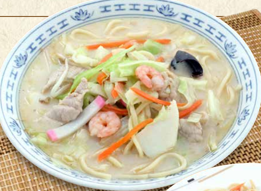
長崎ちゃんぽん 846円(税込930円)