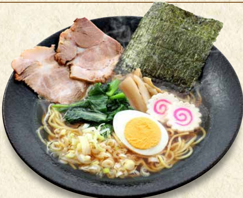
東京下町ラーメン 846円 (税込930円)