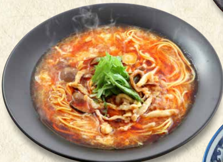
スーラータンメン 酸辣湯麺 846円 (税込930円)