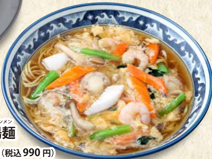
タンメン 海鮮湯麺 900円 (税込990円)