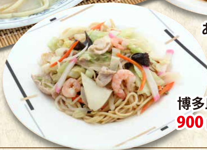
博多皿うどん 900円(税込990円)