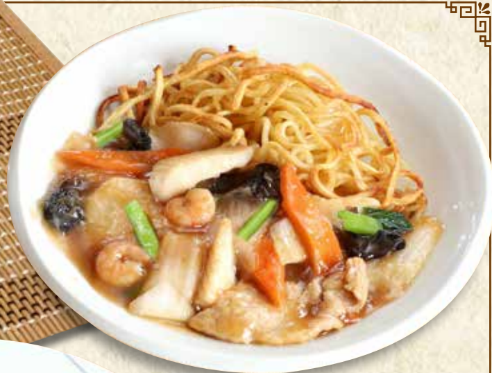
あんかけ焼きそば 846円(税込930円)