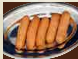
あらびきソーセージ