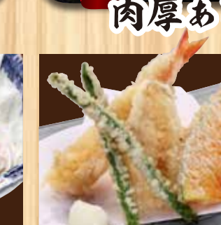
天ぷら盛り合わせ