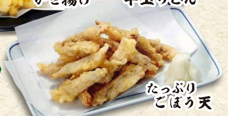
たっぷり ごぼろ天