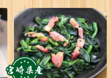
宮崎県産 ほうれん草のバターソテー