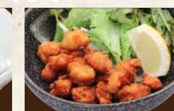
鶏なんこつの唐揚げ