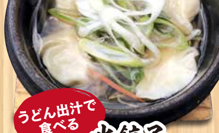
うどん出汁で 食べる