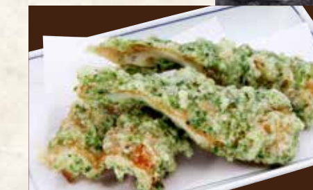
ちくわの磯辺揚げ