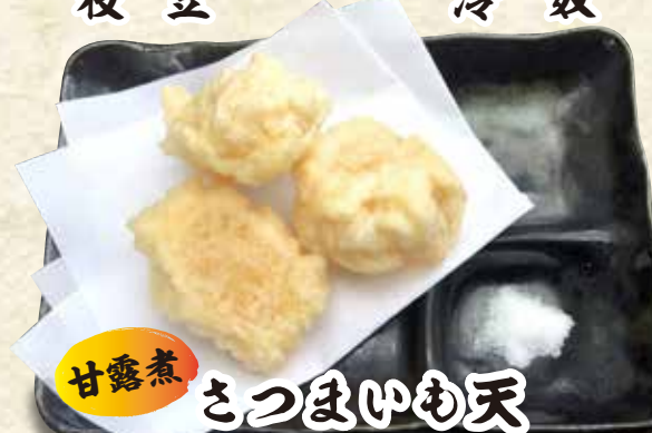
甘露煮 みつめゆも天