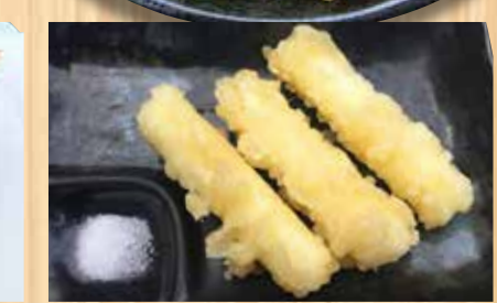
モッツアレチーズ天ぷら