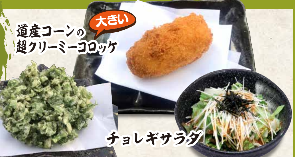
道産コーンの 超クリーミーコロケ 大きい 春菊のかき揚げ チョレギサラダ