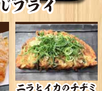
ニラとイカのチヂミ