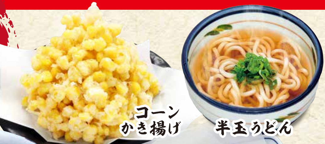
コーン かき揚げ 半玉うどん