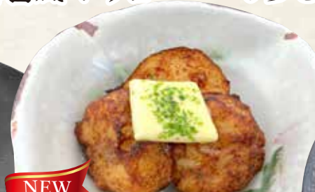
揚げじゃがバター