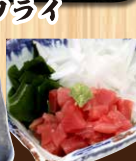
まぐろ切り落とし