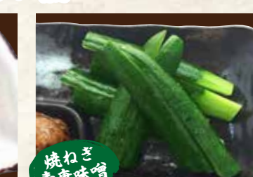
焼ねさ 香唐味噌 もうきゅう