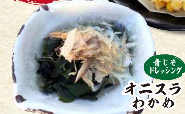
青しそ ドレッシング オニスラ わかめ