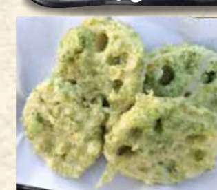
れんこん磯辺揚げ