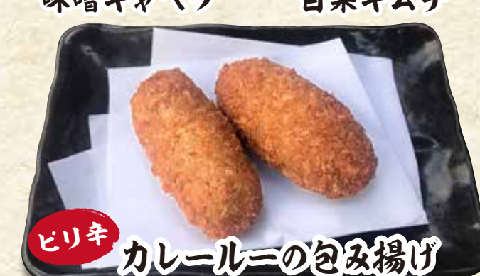
ピリ辛 カレー味の包み揚げ