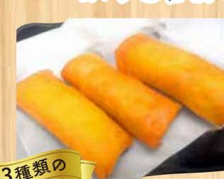
3種類の 濃厚チーズロール