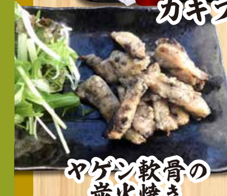
ヤゲン軟骨の 炭火焼き