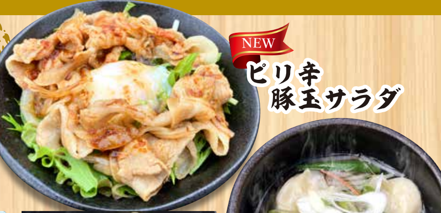
NEW ピリ辛 豚玉サラダ 水餃子