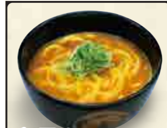
和風カレーうどん 580円