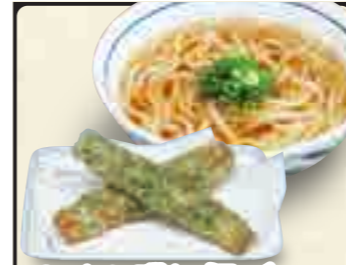
ちくわ磯辺揚げうどん 600円