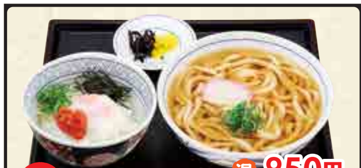
ミニ 温 850円 明太ご飯セット 冷 950円