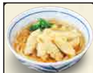
ごぼう天うどん 520円