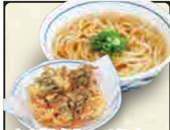
紅生姜と舞茸のかき揚げうどん 630円