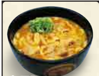
和風豚カレーうどん 780円