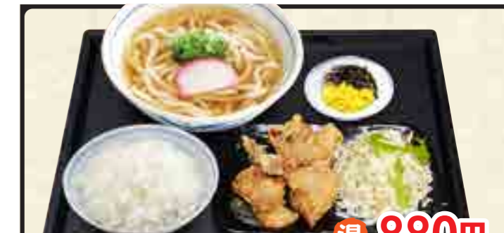
温 880円 唐揚げ定食 冷 980円