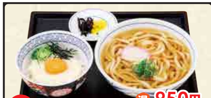
ミニ 温 850円 山かけ丼セット 冷 950円