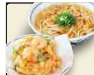
かき揚げうどん 650円