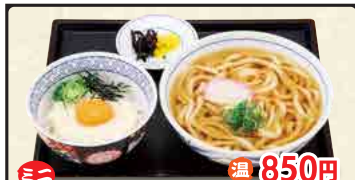
ミニ 温 850円 山かけ丼セット 冷 950円