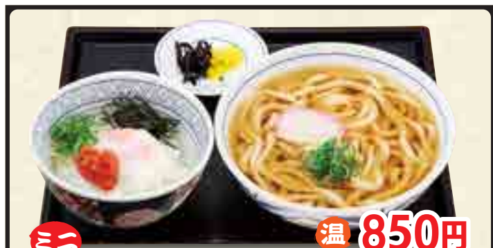
ミニ 温 850円 明太ご飯セット 冷 950円