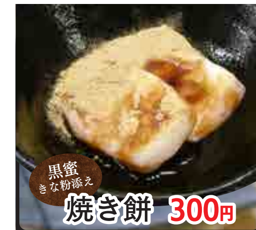
黒蜜 きな粉添え 焼き餅 300円