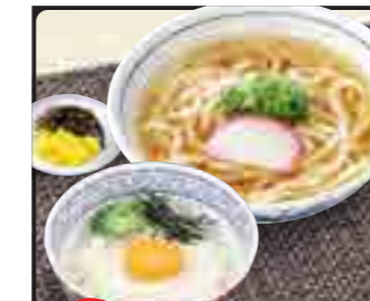
山かけ丼 セット 温 850円 冷 950円