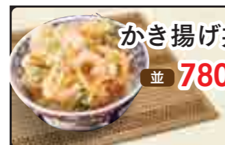
かき揚げ丼 並 780円