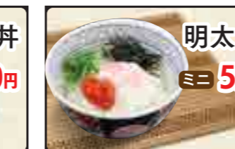
明太ご飯 ミニ 520円