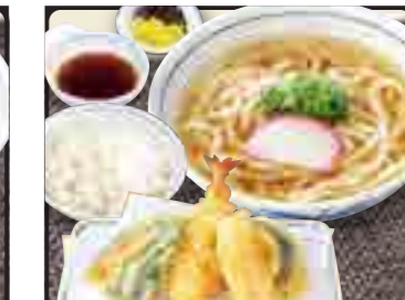
うどん定食 セット 温 980円 冷 1,080円