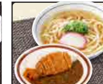
カツカレー セット 温 1,200円 冷 1,300円