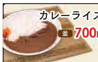
カレーライス 並 700円