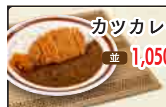
カツカレー 並 1,050円