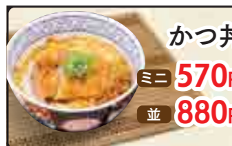
カツ丼 ミニ 570円 並 880円