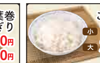
ごはん 小 180円 大 280円