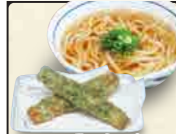
ちくわ磯辺揚げうどん 600円