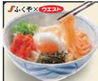
明太釜玉うどん 780円