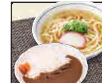
カレー セット 温 850円 冷 950円