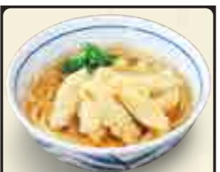
ごぼう天うどん 520円