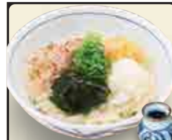
おろしぶっかけうどん 600円