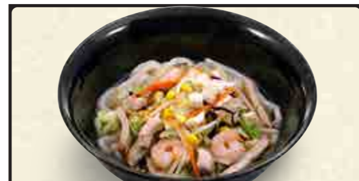
和風ちゃんぽん 880円