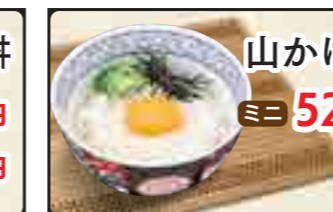
山かけ丼 ミニ 520円