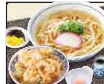
かき揚げ丼 セット 温 880円 冷 980円