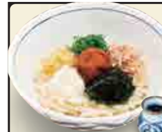
梅ぶっかけうどん 750円