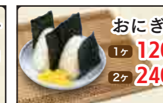
おにぎり 1ヶ 120円 2ヶ 240円