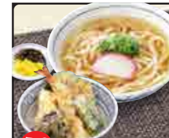
あじわい天丼 セット 温 950円 冷 1,050円