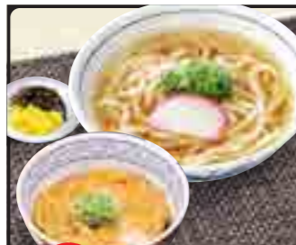
玉子丼 セット 温 750円 冷 850円