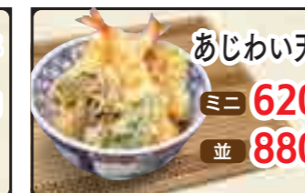
あじわい天丼 ミニ 620円 並 880円