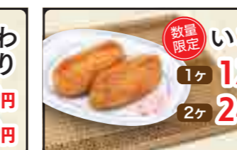
数量限定 いなり 1ヶ 120円 2ヶ 240円