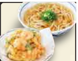
かき揚げうどん 650円