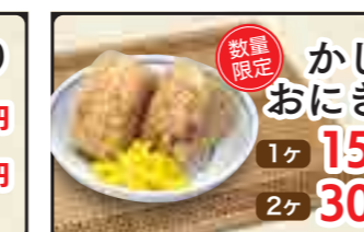
数量限定 かしわおにぎり 1ヶ 150円 2ヶ 300円