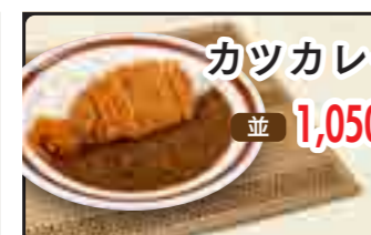
カツカレー 並 1,050円