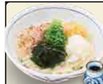
おろしぶっかけうどん 600円