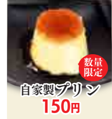
数量限定 自家製プリン 150円