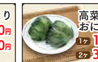
高菜葉巻おにぎり 1ヶ 150円 2ヶ 300円