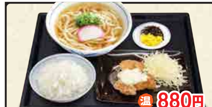
チキン南蛮定食 温 880円 冷 980円