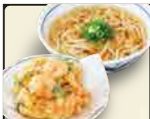
かき揚げうどん 650円