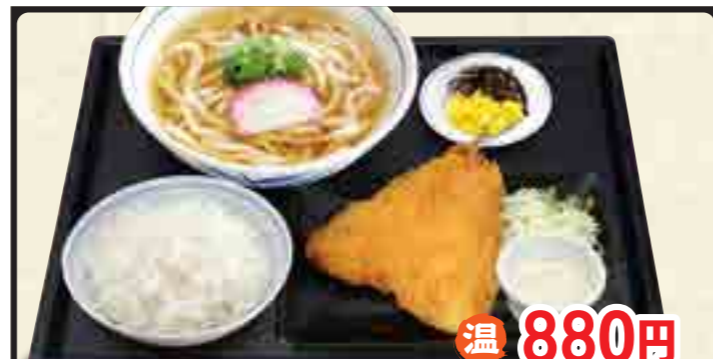
アジフライ定食 温 880円 冷 980円