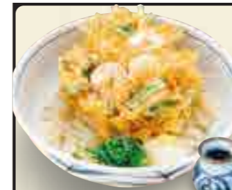
かき揚げぶっかけうどん 750円