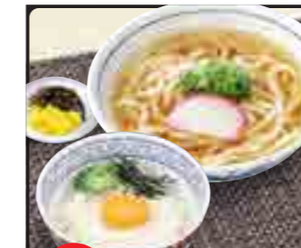
山かけ丼 セット 温 850円 冷 950円