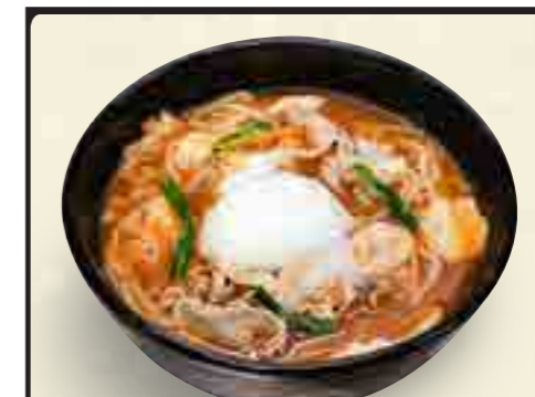
豚キムチうどん 790円