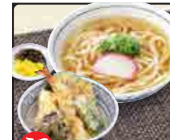
あじわい天丼 セット 温 950円 冷 1,050円