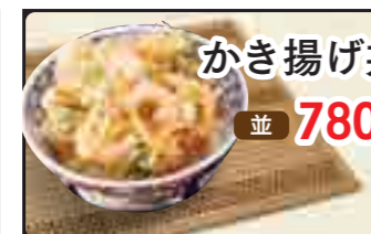
かき揚げ丼 並 780円