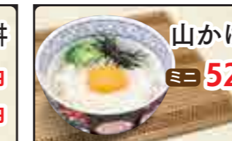
山かけ丼 ミニ 520円