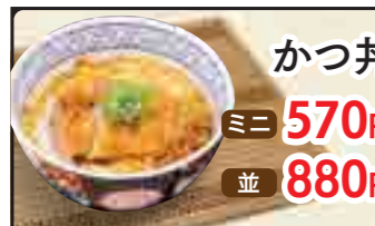
カツ丼 ミニ 570円 並 880円