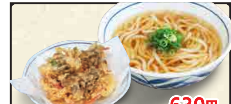
紅生姜と舞茸のかき揚げうどん 630円