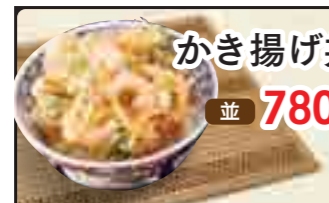
かき揚げ丼 並 780円