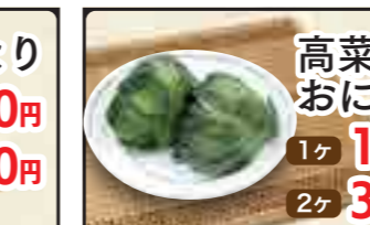
高菜葉巻おにぎり 1ヶ 150円 2ヶ 300円