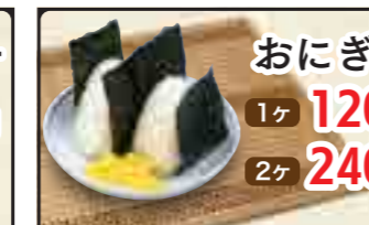
おにぎり 1ヶ 120円 2ヶ 240円