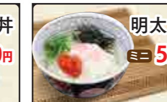
明太ご飯 ミニ 520円