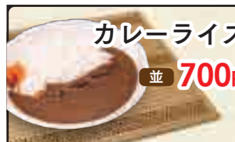
カレーライス 並 700円