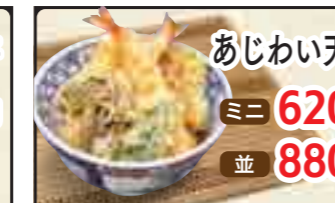
あじわい天丼 ミニ 620円 並 880円