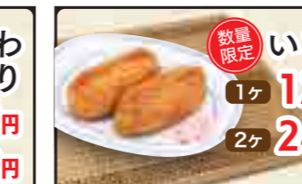
数量限定 いなり 1ヶ 120円 2ヶ 240円