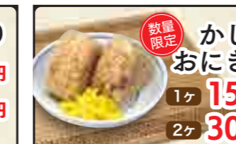
数量限定 かしわおにぎり 1ヶ 150円 2ヶ 300円