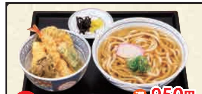
ミニ あじわい天丼セット 温 950円 冷 1,050円