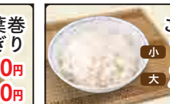
ごはん 小 180円 大 280円