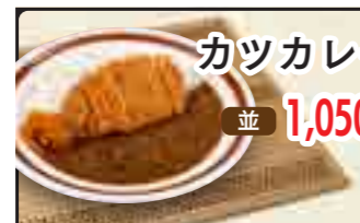
カツカレー 並 1,050円