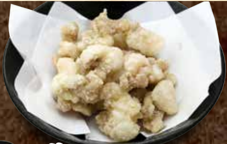
塩ホルモンの唐揚げ