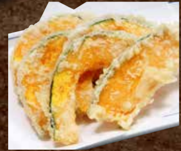
かぼちゃの天ぷら