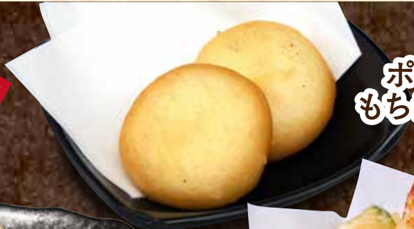
ポテトもちチーズ