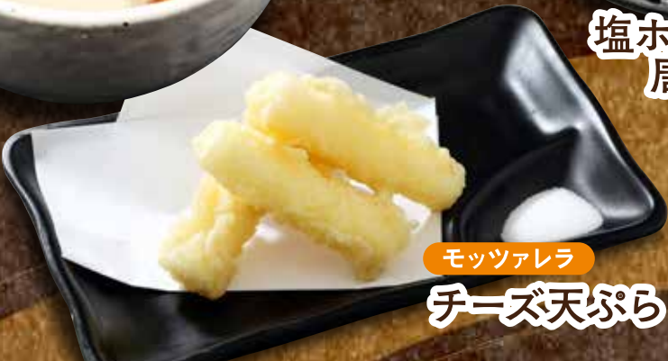
モッツアレラチーズ天ぷら