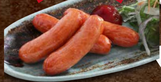
あらびきウインナー