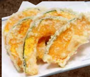
かぼちゃの天ぷら