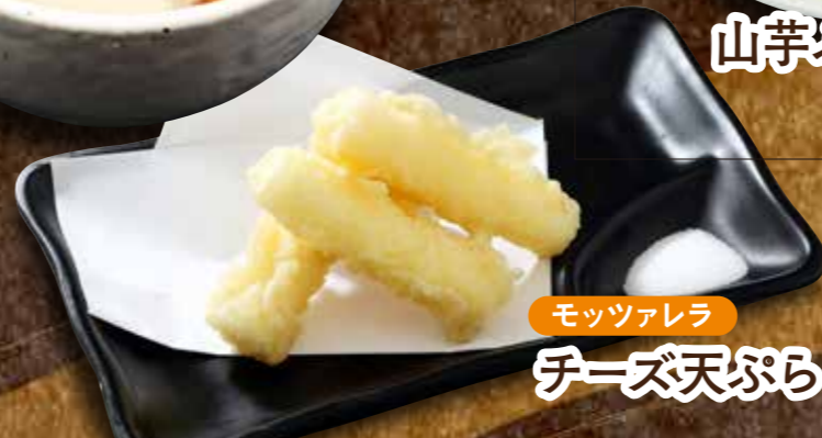
モッツアレラ チーズ天ぷら