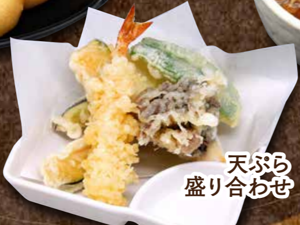
天ぷら 盛り合わせ