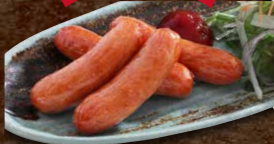
あらびきウインナー