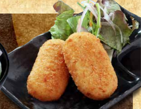
カニクリーム コロッケ