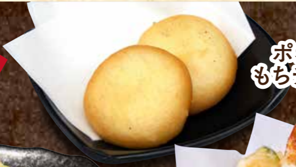
ポテト もちチーズ