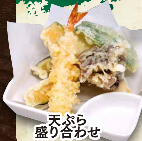
天ぷら 盛り合わせ