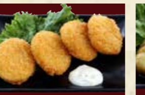
クリーミーコーンコロッケ