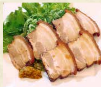
ネギチャーシュー