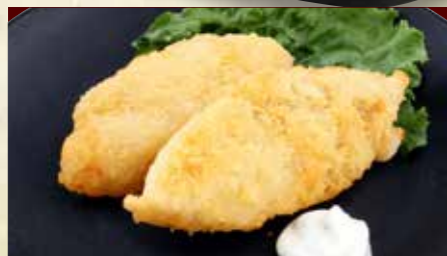
ひとくち白身フライ