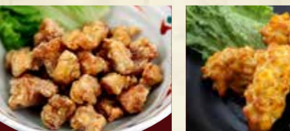
鶏なんこつ唐揚げ