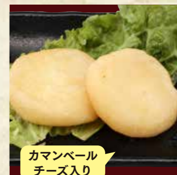
カマンベール チーズ入り