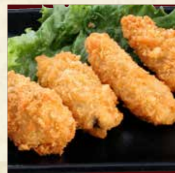
カキフライタルタル