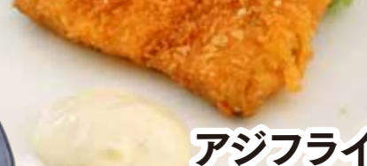
アジフライ タルタル